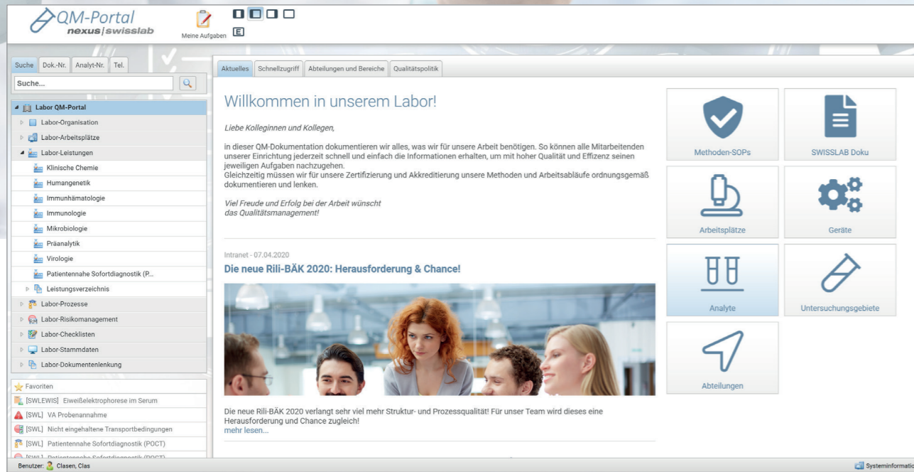
Startseite des QM-Portals