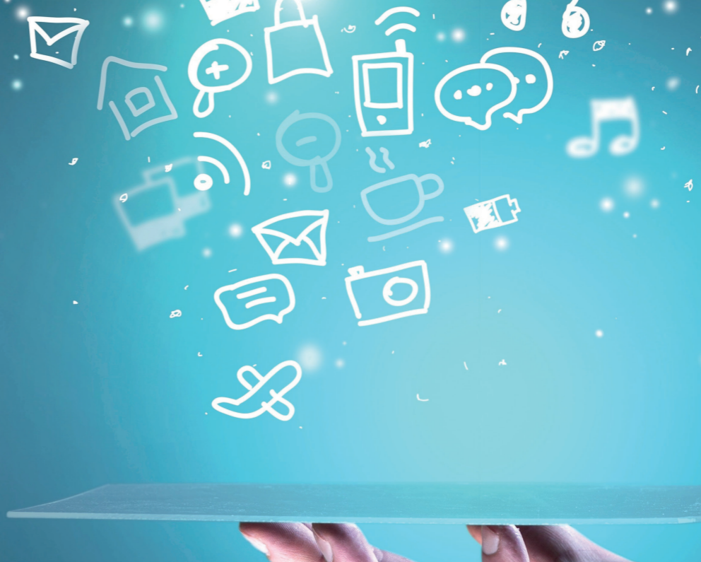
Startseite NEXUS / CURATOR